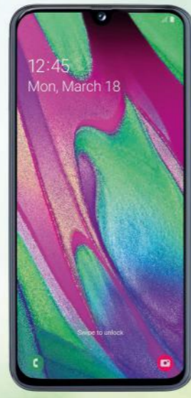
Samsung Galaxy A40 im Tarif Allnet Flat Plus 15