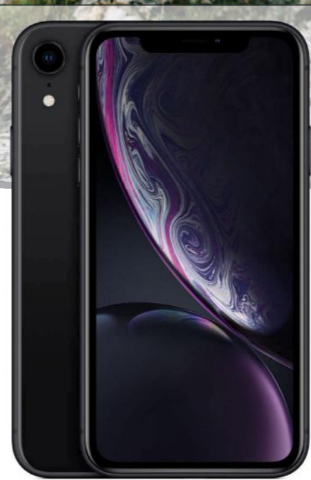
Apple iPhone XR (64 GB) im Neuvertrag MagentaMobil Special m. Smartphone 1 mit einer Mindestlaufzeit von 24 Monaten