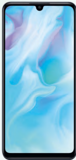
Huawei P30 lite im Tarif Allnet Flat Plus 15

LTE 50 für nur 3€ / Monat 16 : Monatlich zu- und abbuchbar